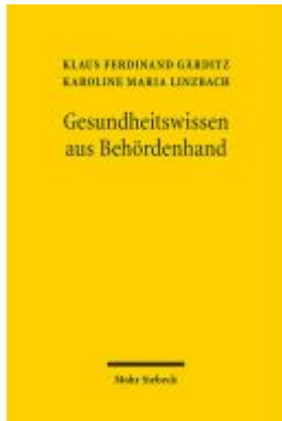
Gesundheitswissen aus Behördenhand Ladenpreis: 71,00EUR