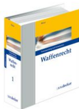
Waffenrecht Ladenpreis: 475,00EUR