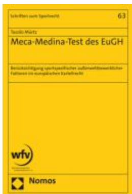
Meca-Medina-Test des EuGH Ladenpreis: 142,90EUR

Wir haben andere Produkte gefunden, die Ihnen gefallen könnten!