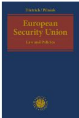
European Security Union Ladenpreis: 185,10EUR