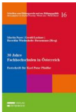
30 Jahre Fachhochschulen in Österreich Ladenpreis: 95,00EUR