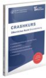
CRASHKURS Öffentliches Recht - Brandenburg Ladenpreis: 27,70EUR