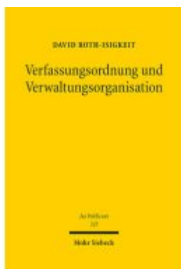
Verfassungsordnung und Verwaltungsorganisation Ladenpreis: 142,90EUR