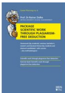
Package Scientific work through plagiarism-free deduction Ladenpreis: 50,30EUR