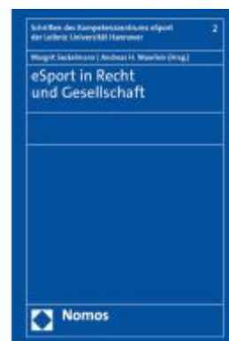
eSport in Recht und Gesellschaft Ladenpreis: 86,40EUR