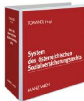
System des österreichischen Sozialversicherungsrechts Ladenpreis: 258,00 EUR