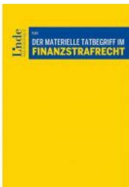
Der materielle Tatbegriff im Finanzstrafrecht Ladenpreis: 62,00 EUR