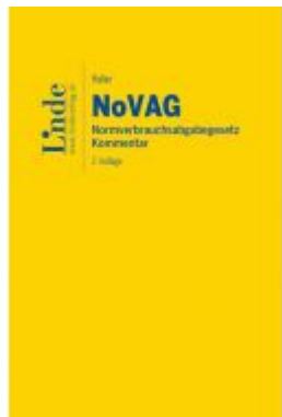
NoVAG | Normverbrauchsabgabegesetz Ladenpreis: 89,00 EUR