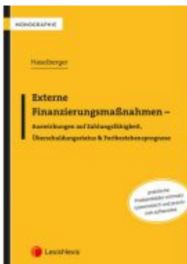
Externe Finanzierungsmaßnahmen - Auswirkungen auf Zahlungsfähigkeit, Überschuldungsstatus & Fortbestehensprognose Ladenpreis: 46,00 EUR