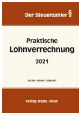
Praktische Lohnverrechnung 2021 Ladenpreis: 58,30 EUR