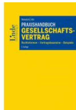
Praxishandbuch Gesellschaftsvertrag Ladenpreis: 74,00 EUR