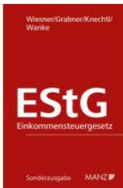
Einkommensteuergesetz EStG Ladenpreis: 398,00 EUR