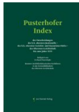
Pusterhofer Index Ladenpreis: 198,00 EUR