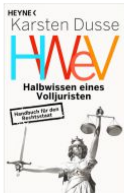
Halbwissen eines Volljuristen Ladenpreis: 12,40EUR