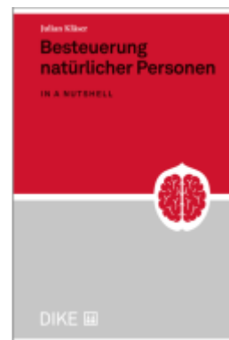
Besteuerung natürlicher Personen in a nutshell Ladenpreis: 48,00EUR