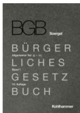
Kommentar zum Bürgerlichen Gesetzbuch mit Einführungsgesetz und Nebengesetzen (BGB) (Soergel)