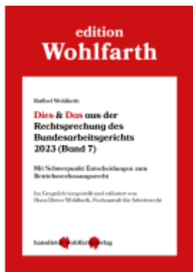
Dies & Das aus der Rechtsprechung des Bundesarbeitsgerichts 2023 Ladenpreis: 30,80EUR