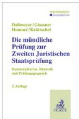
Die mündliche Prüfung zur Zweiten Juristischen Staatsprüfung Ladenpreis: 38,00EUR