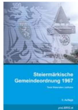
Steiermärkische Gemeindeordnung 1967 Ladenpreis: 26,00EUR