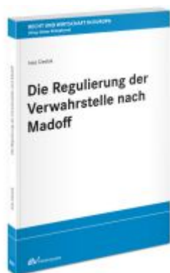
Die Regulierung der Verwahrstelle nach Madoff Ladenpreis: 91,50EUR