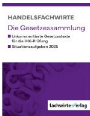
Handelsfachwirte - Die Gesetzessammlung 2025 Ladenpreis: 30,70EUR