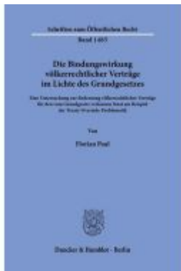
Die Bindungswirkung völkerrechtlicher Verträge im Lichte des Grundgesetzes. Ladenpreis: 71,90EUR

Wir haben andere Produkte gefunden, die Ihnen gefallen könnten!