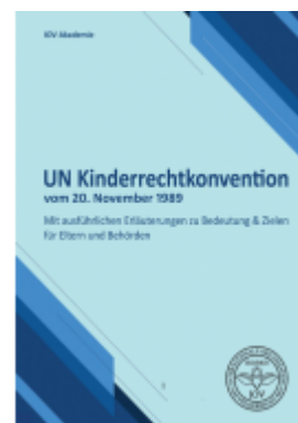
UN Kinderrechtskonvention vom 20. November 1989 Ladenpreis: 25,70EUR