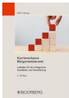
Karrierechance Bürgermeisteramt Ladenpreis: 49,40EUR