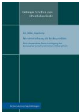
Warenvernichtung als Rechtsproblem Ladenpreis: 28,80EUR