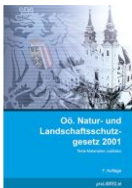
Oö. Natur- und Landschaftsschutzgesetz 2001 Ladenpreis: 28,00EUR