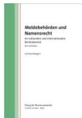
Meldebehörden und Namensrecht Ladenpreis: 35,60EUR