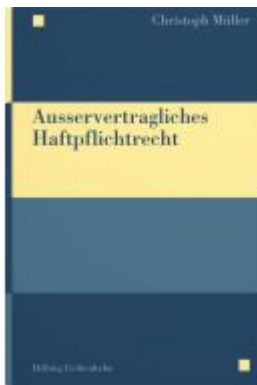
Ausservertragliches Haftpflichtrecht Ladenpreis: 108,00EUR