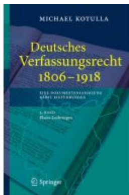
Deutsches Verfassungsrecht 1806 - 1918