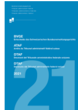
BVGE 2021 Ladenpreis: 90,00EUR