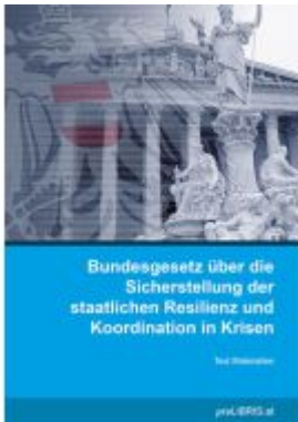
Bundesgesetz über die Sicherstellung der staatlichen Resilienz und Koordination in Krisen