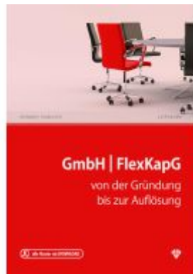
GmbH & FlexKapG Ladenpreis: 44,00EUR