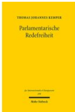
Parlamentarische Redefreiheit Ladenpreis: 91,50EUR