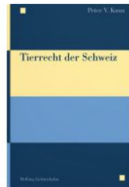
Tierrecht der Schweiz