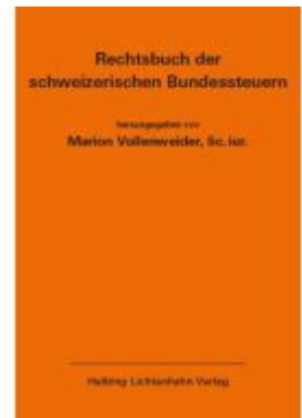
Rechtsbuch der schweizerischen Bundessteuern EL 180 Ladenpreis: 306,00EUR