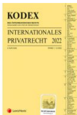
KODEX Internationales Privatrecht 2022 - inkl. App Ladenpreis: 34,00 EUR