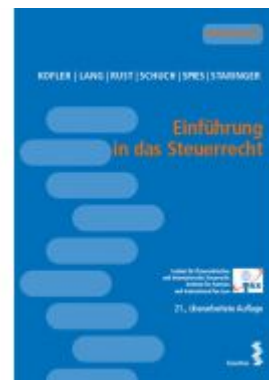
Einführung in das Steuerrecht Ladenpreis: 22,00 EUR