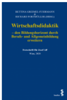
Wirtschaftsdidaktik Ladenpreis: 58,00 EUR

Wir haben andere Produkte gefunden, die Ihnen gefallen könnten!