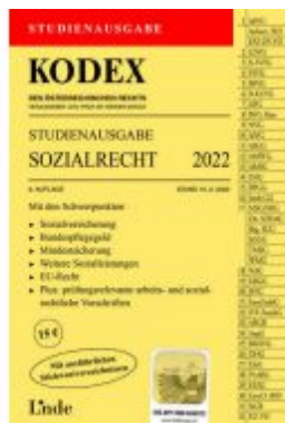
KODEX Studienausgabe Sozialrecht 2022 Ladenpreis: 15,00 EUR