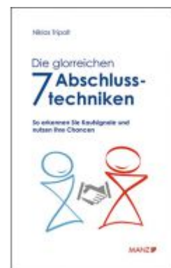
Die glorreichen 7 Abschlusstechniken Ladenpreis: 21,90 EUR