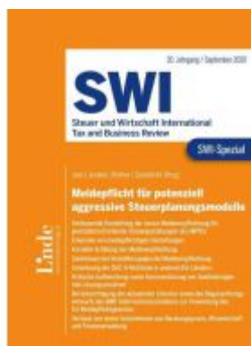
SWI-Spezial Meldepflicht für potenziell aggressive Steuerplanungsmodelle Ladenpreis: 58,00 EUR