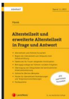
Altersteilzeit und erweiterte Altersteilzeit in Frage und Antwort Ladenpreis: 37,00 EUR