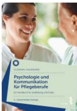
Psychologie und Kommunikation für Pflegeberufe Ladenpreis: 32,90 EUR