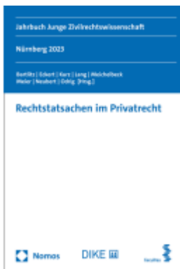
Rechtstatsachen im Privatrecht