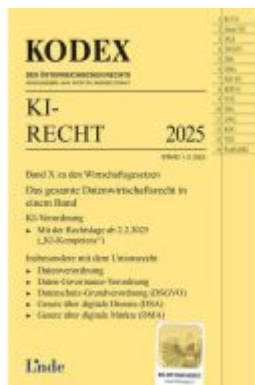
KODEX KI-Recht 2025 Ladenpreis: 24,00EUR