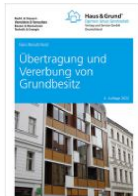
Übertragung und Vererbung von Grundbesitz Ladenpreis: 30,80EUR