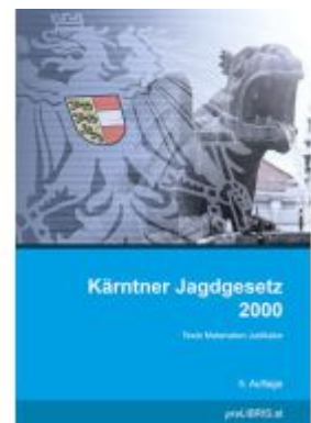
Kärntner Jagdgesetz 2000