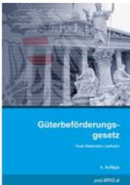
Güterbeförderungsgesetz Ladenpreis: 33,00EUR

Wir haben andere Produkte gefunden, die Ihnen gefallen könnten!