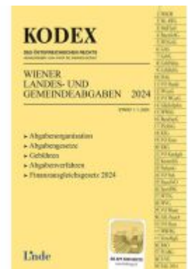
KODEX Wiener Landes- und Gemeindeabgaben Ladenpreis: 29,00EUR