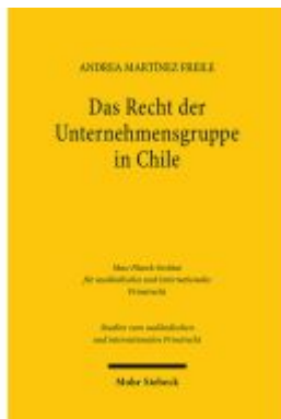
Das Recht der Unternehmensgruppe in Chile