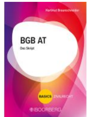
BGB AT Ladenpreis: 22,50EUR