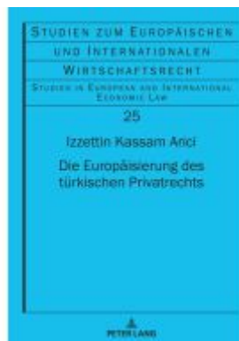
Die Europäisierung des türkischen Privatrechts Ladenpreis: 107,90EUR