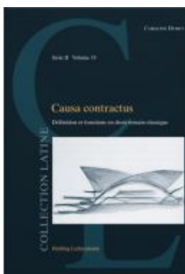
Causa contractus Ladenpreis: 82,00EUR