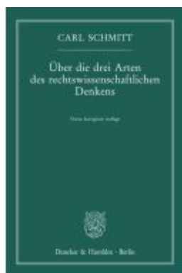
Über die drei Arten des rechtswissenschaftlichen Denkens. Ladenpreis: 20,50EUR