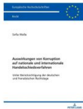
Auswirkungen von Korruption auf nationale und internationale Handelsschiedsverfahren Ladenpreis: 61,60EUR