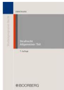
Strafrecht Allgemeiner Teil Ladenpreis: 26,70EUR