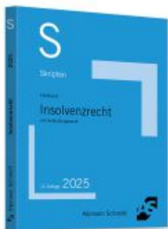
Skript Insolvenzrecht Ladenpreis: 25,60EUR