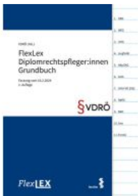
FlexLex Diplomrechtspfleger:innen Grundbuch Ladenpreis: 18,00EUR