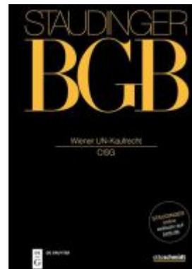
Wiener UN-Kaufrecht Ladenpreis: 449,00EUR