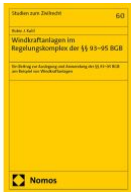
Windkraftanlagen im Regelungskomplex der §§ 93–95 BGB Ladenpreis: 127,50EUR