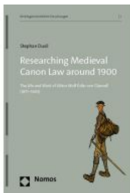
Researching Medieval Canon Law around 1900 Ladenpreis: 45,30EUR