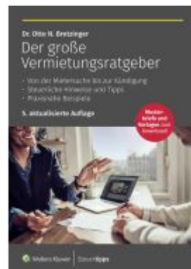
Der große Vermietungsratgeber Ladenpreis: 29,99EUR