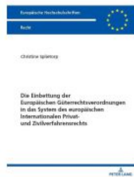
Die Einbettung der Europäischen Güterrechtsverordnungen in das System des europäischen Internationalen Privat- und Zivilverfahrensrechts Ladenpreis: 84,30EUR