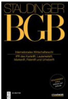
Internationales Wirtschaftsrecht Ladenpreis: 239,00EUR

Wir haben andere Produkte gefunden, die Ihnen gefallen könnten!