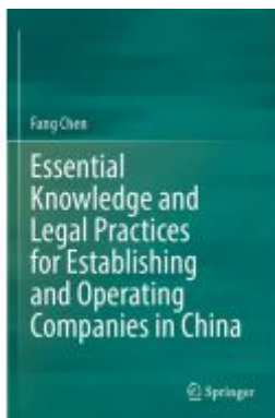
Essential Knowledge and Legal Practices for Establishing and Operating Companies in China Ladenpreis: 109,99EUR