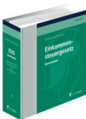
Einkommensteuergesetz Ladenpreis: 293,00EUR