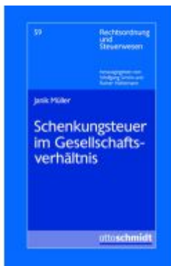
Schenkungssteuer im Gesellschaftsverhältnis Ladenpreis: 82,10EUR