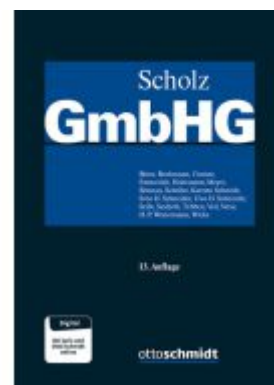
GmbH-Gesetz, Band I Ladenpreis: 235,50EUR