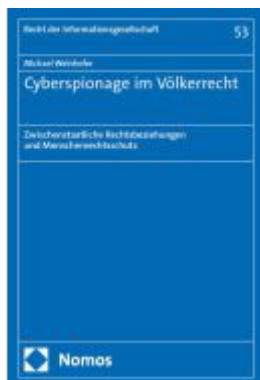
Cyberspionage im Völkerrecht Ladenpreis: 101,80EUR