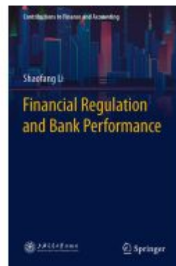
Financial Regulation and Bank Performance Ladenpreis: 109,99EUR