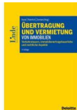
Übertragung und Vermietung von Immobilien Ladenpreis: 64,00EUR