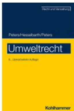
Umweltrecht Ladenpreis: 41,10EUR