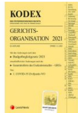
KODEX Gerichtsorganisation 2021 - inkl. App Ladenpreis: 76,00 EUR