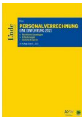
Personalverrechnung: eine Einführung 2021 Ladenpreis: 38,00 EUR