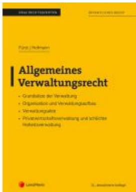
Allgemeines Verwaltungsrecht (Skriptum) Ladenpreis: 21,00 EUR