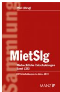
Mietrechtliche Entscheidungen MietSlg Ladenpreis: 224,00 EUR