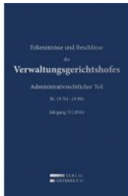
Erkenntnisse und Beschlüsse des Verwaltungsgerichtshofes Ladenpreis: 476,00 EUR