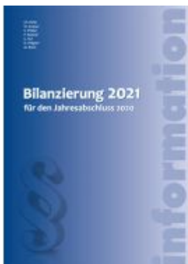
Bilanzierung 2021 Ladenpreis: 44,90 EUR

Wir haben andere Produkte gefunden, die Ihnen gefallen könnten!