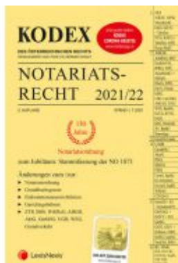
KODEX Notariatsrecht 2021/22 - inkl. App Ladenpreis: 45,00 EUR