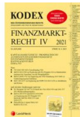
KODEX Finanzmarktrecht Band IV 2021 Ladenpreis: 81,00 EUR