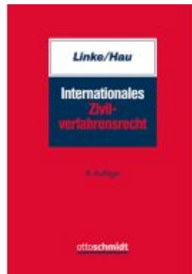
Internationales Zivilverfahrensrecht Ladenpreis: 51,20EUR