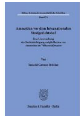
Amnestien vor dem Internationalen Strafgerichtshof Ladenpreis: 102,70EUR