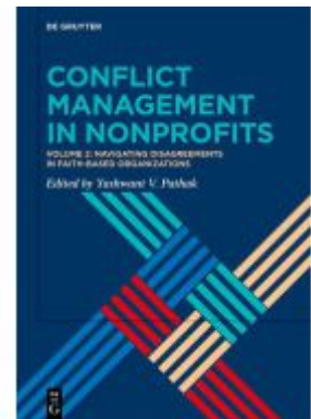
Conflict Management in Nonprofits Ladenpreis: 109,95EUR