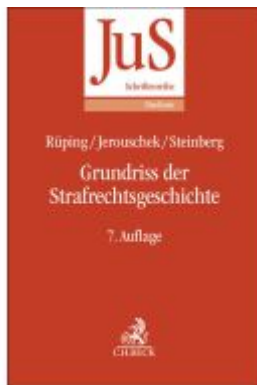
Grundriss der Strafrechtsgeschichte Ladenpreis: 25,60EUR