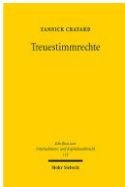
Treuestimmrechte Ladenpreis: 101,80EUR