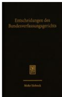
Entscheidungen des Bundesverfassungsgerichts (BVerfGE) Ladenpreis: 55,60EUR