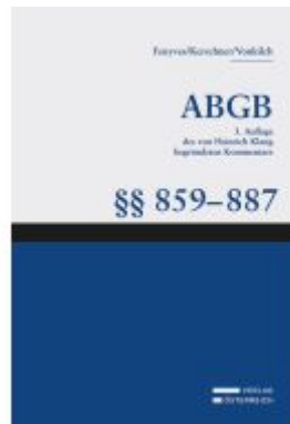
Großkommentar zum ABGB - Klang Kommentar Ladenpreis: 544,00EUR