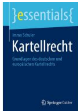
Kartellrecht Ladenpreis: 15,41EUR