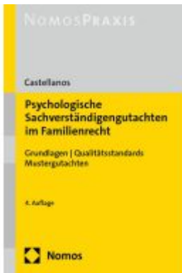
Psychologische Sachverständigengutachten im Familienrecht Ladenpreis: 50,40EUR