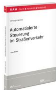
Hochautomatisiertes Fahren in Deutschland und Kalifornien Ladenpreis: 91,50EUR