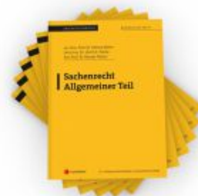
PAKET Edition Zivilrecht (Skripten) Ladenpreis: 135,00EUR