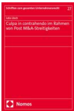
Culpa in contrahendo im Rahmen von Post M&A-Streitigkeiten Ladenpreis: 86,40EUR