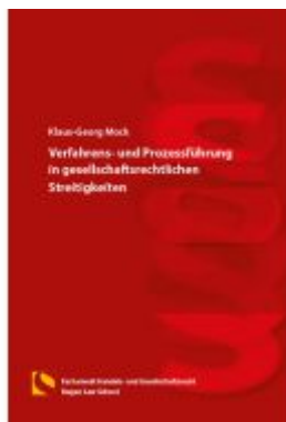
Verfahrens- und Prozessführung in gesellschaftsrechtlichen Streitigkeiten Ladenpreis: 25,70EUR