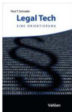
Legal Tech Ladenpreis: 25,60EUR