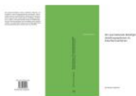
Der querstehende Beteiligte Ladenpreis: 49,50EUR