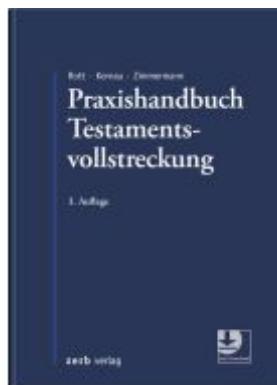
Praxishandbuch Testamentsvollstreckung Ladenpreis: 91,50EUR