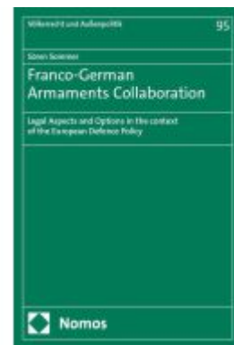
Franco-German Armaments Collaboration Ladenpreis: 112,10EUR