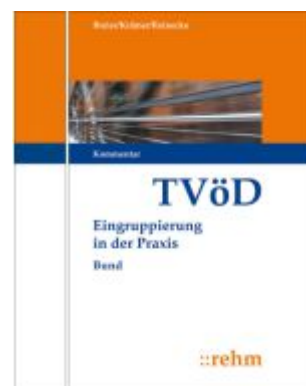
TVöD Entgeltordnung Bund Ladenpreis: 410,20EUR