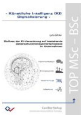
Einfluss der KI-Verordnung auf bestehende Datenschutzmanagementprozesse im Unternehmen Ladenpreis: 37,00EUR