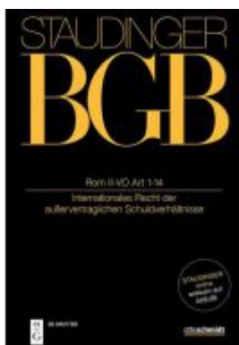
Art 1-3; 10-14 Rom II-VO Ladenpreis: 139,95EUR