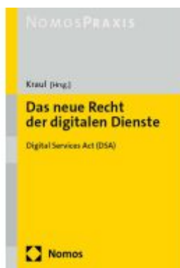
Das neue Recht der digitalen Dienste Ladenpreis: 60,70EUR