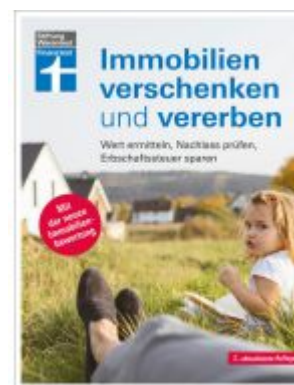
Immobilien verschenken und vererben Ladenpreis: 23,60EUR