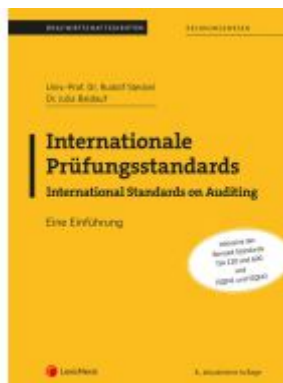
Internationale Prüfungsstandards- International Standards on Auditing Ladenpreis: 31,50EUR