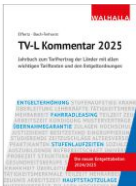
TV-L Kommentar 2025 Ladenpreis: 49,30EUR

Wir haben andere Produkte gefunden, die Ihnen gefallen könnten!