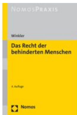
Das Recht der behinderten Menschen Ladenpreis: 49,40EUR