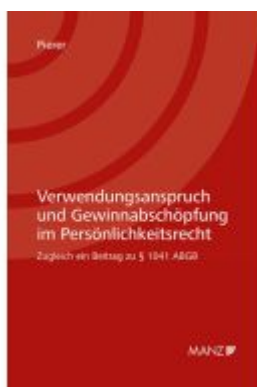
Verwendungsanspruch und Gewinnabschöpfung im Persönlichkeitsrecht Ladenpreis: 44,00EUR