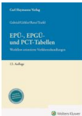
EPÜ-, EPGÜ- und PCT-Tabellen Ladenpreis: 132,70EUR