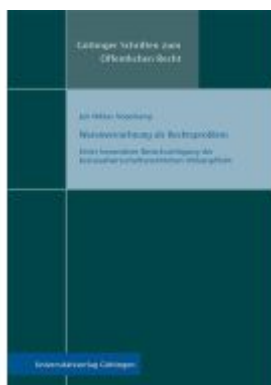
Warenvernichtung als Rechtsproblem Ladenpreis: 28,80EUR