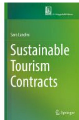
Sustainable Tourism Contracts Ladenpreis: 93,49EUR