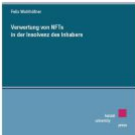
Verwertung von NFTs in der Insolvenz des Inhabers Ladenpreis: 29,90EUR