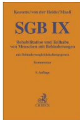
SGB IX Ladenpreis: 122,40EUR