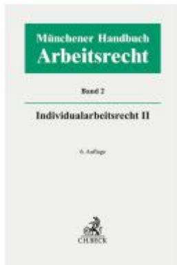
Münchener Handbuch zum Arbeitsrecht Bd. 2: Individualarbeitsrecht II Ladenpreis: 225,20EUR