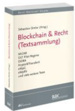
Blockchain & Recht (Textsammlung) Ladenpreis: 40,10EUR