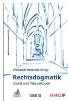
Rechtsdogmatik - Stand und Perspektiven Ladenpreis: 90,00EUR