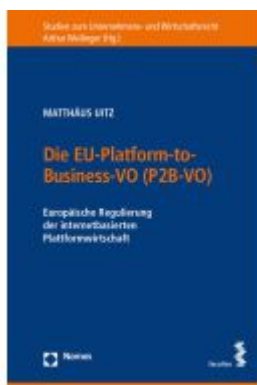
Die EU-Plattform-to-Business-VO (P2B-VO) Ladenpreis: 68,00EUR