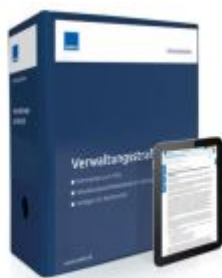
Verwaltungsstrafrecht Ladenpreis: 250,80EUR