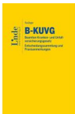
B-KUVG | Beamten-Kranken- und Unfallversicherungsgesetz - Entscheidungssammlung und Praxisanmerkungen Ladenpreis: 89,00EUR