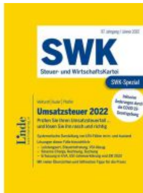
SWK-Spezial Umsatzsteuer 2022 Ladenpreis: 52,00EUR