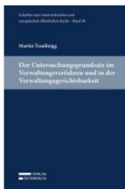
Der Untersuchungsgrundsatz im Verwaltungsverfahren und in der Verwaltungsgerichtsbarkeit Ladenpreis: 59,00EUR