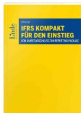
IFRS kompakt für den Einstieg Ladenpreis: 28,00EUR