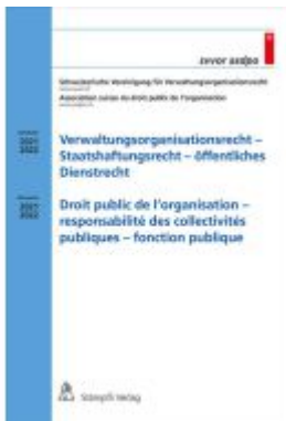
Verwaltungsorganisationsrecht - Staatshaftungsrecht - öffentliches Dienstrecht Droit public de l'organisation - responsabilité des collectivités publiques - fonction publique Ladenpreis: 87,10EUR