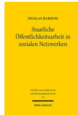
Staatliche Öffentlichkeitsarbeit in sozialen Netzwerken Ladenpreis: 96,70EUR