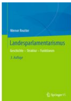
Landesparlamentarismus Ladenpreis: 143,92EUR