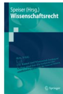
Wissenschaftsrecht Ladenpreis: 28,78EUR