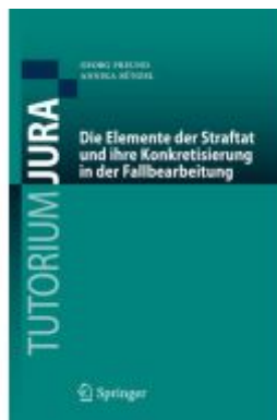
Die Elemente der Straftat und ihre Konkretisierung in der Fallbearbeitung Ladenpreis: 41,11EUR