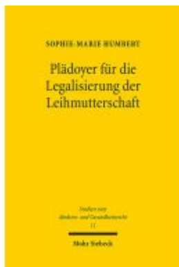
Plädoyer für die Legalisierung der Leihmutterschaft Ladenpreis: 107,00EUR