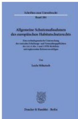
Allgemeine Schutzmaßnahmen des europäischen Habitatschutzrechts. Ladenpreis: 92,50EUR