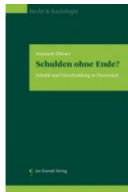
Schulden ohne Ende? Ladenpreis: 85,00 EUR