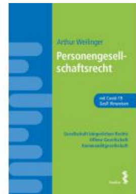
Personengesellschaftsrecht Ladenpreis: 24,00 EUR