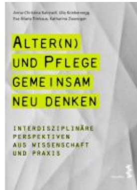
Alter(n) und Pflege gemeinsam neu denken Ladenpreis: 19,90 EUR