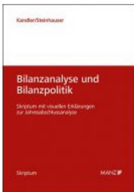
Bilanzanalyse und Bilanzpolitik Ladenpreis: 24,90 EUR