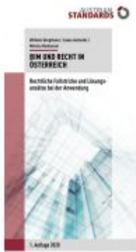
Building Information Modeling und Recht in Österreich Ladenpreis: 29,70 EUR