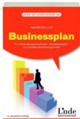
Businessplan Ladenpreis: 19,90 EUR

Wir haben andere Produkte gefunden, die Ihnen gefallen könnten!