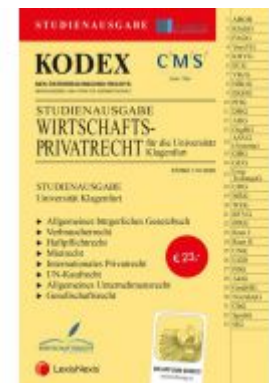
KODEX Wirtschaftsprivatrecht Klagenfurt Ladenpreis: 23,00 EUR