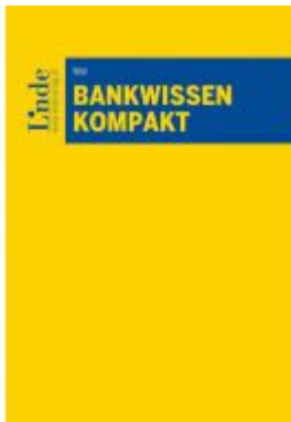
Bankwissen kompakt Ladenpreis: 58,00 EUR