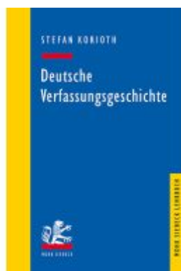
Deutsche Verfassungsgeschichte Ladenpreis: 29,90EUR