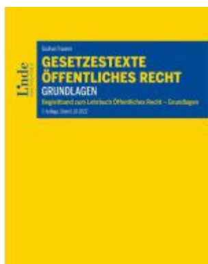
Gesetzestexte Öffentliches Recht - Grundlagen Ladenpreis: 32,00EUR