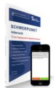
SCHWERPUNKT Völkerrecht Ladenpreis: 24,60EUR