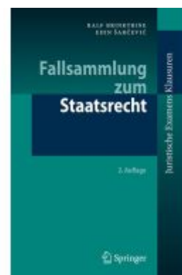
Fallsammlung zum Staatsrecht Ladenpreis: 20,51EUR