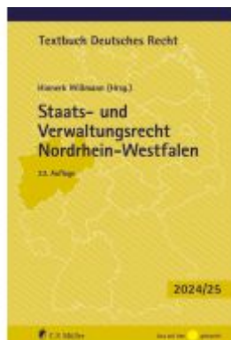
Staats- und Verwaltungsrecht Nordrhein-Westfalen Ladenpreis: 24,70EUR