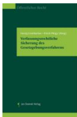
Verfassungsrechtliche Sicherung des Gesetzgebungsverfahrens Ladenpreis: 49,90EUR