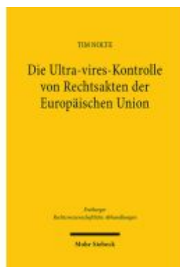
Die Ultra-vires-Kontrolle von Rechtsakten der Europäischen Union Ladenpreis: 112,10EUR