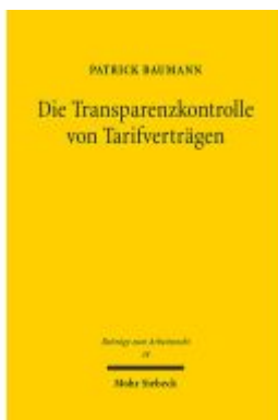
Die Transparenzkontrolle von Tarifverträgen Ladenpreis: 91,50EUR