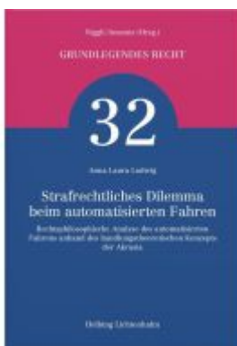
Strafrechtliches Dilemma beim automatisierten Fahren Ladenpreis: 60,00EUR