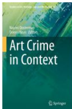
Art Crime in Context Ladenpreis: 175,99EUR

Wir haben andere Produkte gefunden, die Ihnen gefallen könnten!