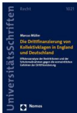
Die Drittfiananzierung von Kollektivklagen in England und Deutschland Ladenpreis: 204,60EUR