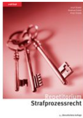
Repetitorium Strafprozessrecht Ladenpreis: 65,80EUR