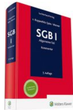
SGB I Kommentar Ladenpreis: 101,80EUR