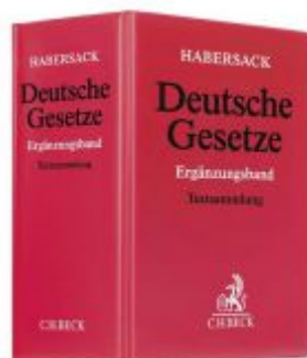
Deutsche Gesetze Ergänzungsband apart Ladenpreis: 50,40EUR