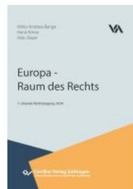
Europa - Raum des Rechts Ladenpreis: 104,70EUR