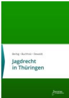
Jagdrecht in Thüringen Ladenpreis: 25,70EUR