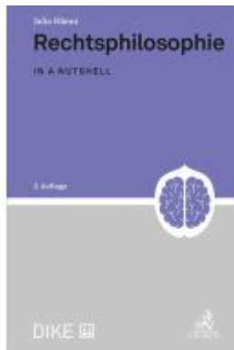
Rechtsphilosophie Ladenpreis: 65,80EUR