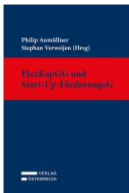
FlexKapGG und Start-Up-FörderungsG Ladenpreis: 149,00EUR