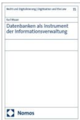
Datenbanken als Instrument der Informationsverwaltung Ladenpreis: 142,90EUR