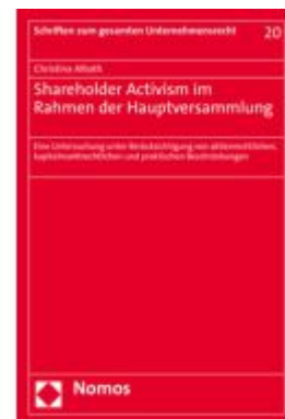
Shareholder Activism im Rahmen der Hauptversammlung Ladenpreis: 91,50EUR