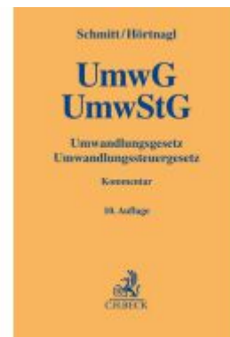
Umwandlungsgesetz, Umwandlungssteuergesetz Ladenpreis: 225,20EUR