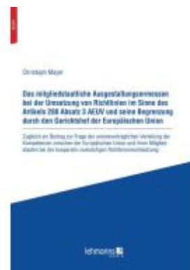
Das mitgliedstaatliche Ausgestaltungsermessen bei der Umsetzung von Richtlinien im Sinne des Artikels 288 Absatz 3 AEUV und seine Begrenzung durch den Gerichtshof der Europäischen Union Ladenpreis: 20,60EUR