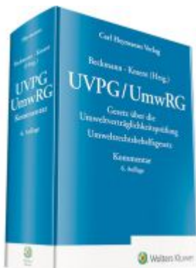
UVPG/UmwRG – Kommentar Ladenpreis: 173,80EUR

Wir haben andere Produkte gefunden, die Ihnen gefallen könnten!