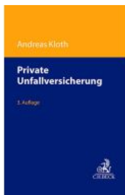
Private Unfallversicherung Ladenpreis: 92,60EUR