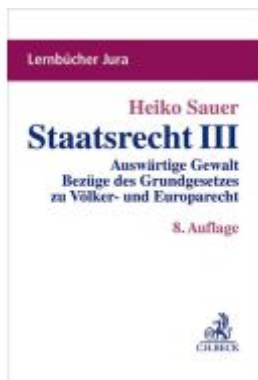
Staatsrecht III Ladenpreis: 26,70EUR