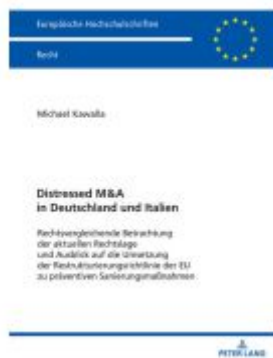
Distressed M&A in Deutschland und Italien Ladenpreis: 71,90EUR