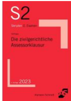
Die zivilgerichtliche Assessorklausur Ladenpreis: 23,60EUR