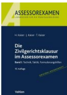
Die Zivilgerichtsklausur im Assessorexamen Ladenpreis: 25,60EUR