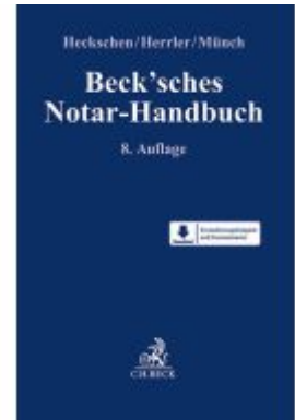
Beck'sches Notar-Handbuch Ladenpreis: 214,90EUR