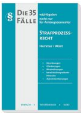
Die 35 wichtigsten Fälle Strafrecht Ladenpreis: 15,30EUR

Wir haben andere Produkte gefunden, die Ihnen gefallen könnten!