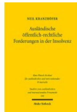
Ausländische öffentlich-rechtliche Forderungen in der Insolvenz Ladenpreis: 86,40EUR