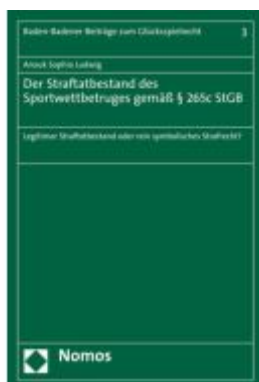
Der Straftatbestand des Sportwettbetruges gemäß § 265c StGB Ladenpreis: 107,00EUR