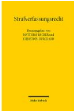
Strafverfassungsrecht Ladenpreis: 86,40EUR