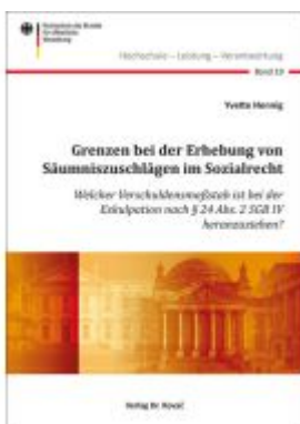
Grenzen bei der Erhebung von Säumniszuschlägen im Sozialrecht Ladenpreis: 80,00EUR