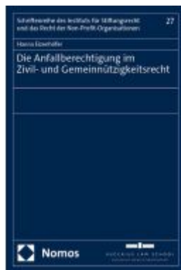
Die Anfallberechtigung im Zivil- und Gemeinnützigkeitsrecht Ladenpreis: 96,70EUR