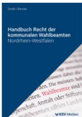
Handbuch Recht der kommunalen Wahlbeamten Ladenpreis: 81,30EUR