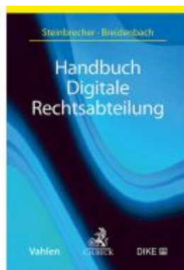
Handbuch Digitale Rechtsabteilung Ladenpreis: 101,80EUR