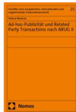
Ad-hoc-Publizität und Related Party Transactions nach ARUG II Ladenpreis: 112,10EUR