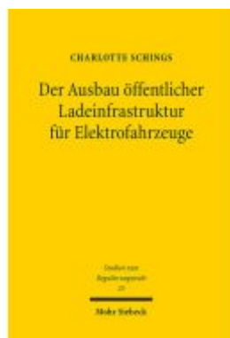
Der Ausbau öffentlicher Ladeinfrastruktur für Elektrofahrzeuge Ladenpreis: 86,40EUR