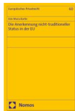
Die Anerkennung nicht-traditioneller Status in der EU Ladenpreis: 163,50EUR