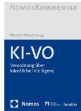
Verordnung über künstliche Intelligenz: KI- VO Ladenpreis: 153,20EUR