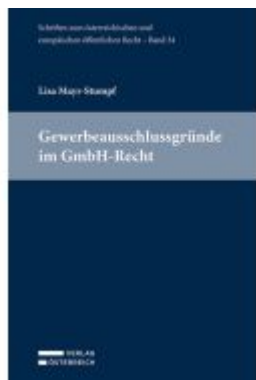
Gewerbeausschlussgründe im GmbH-Recht Ladenpreis: 84,00EUR