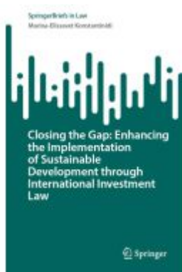
Closing the Gap: Enhancing the Implementation of Sustainable Development through International Investment Law Ladenpreis: 54,99EUR