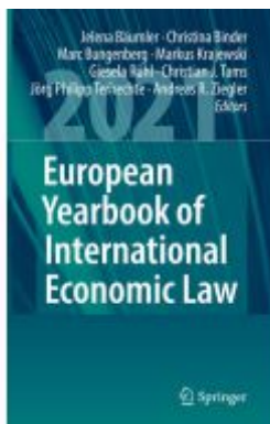
European Yearbook of International Economic Law 2021 Ladenpreis: 175,99EUR