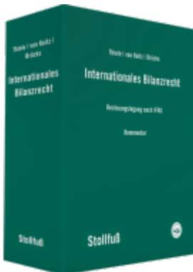
Internationales Bilanzrecht Kommentar Ladenpreis: 862,40EUR