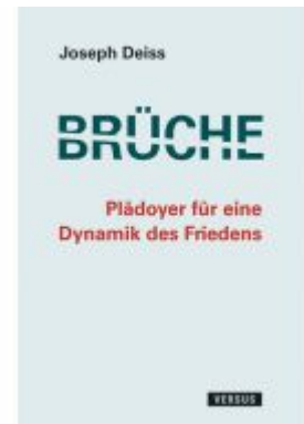
Brüche - Plädoyer für eine Dynamik des Friedens Ladenpreis: 29,80EUR