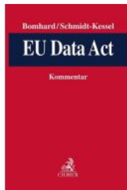
EU Data Act Ladenpreis: 194,30EUR