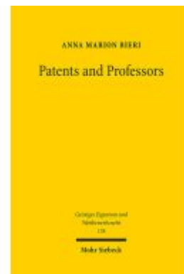
Patents and Professors Ladenpreis: 81,30EUR