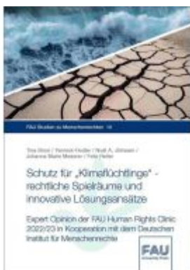
Schutz für „Klimaflüchtlinge“ – rechtliche Spielräume und innovative Lösungsansätze Ladenpreis: 22,10EUR