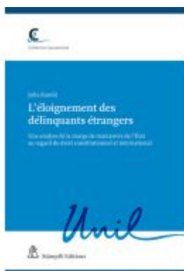
L'éloignement des délinquants étrangers Ladenpreis: 170,50EUR