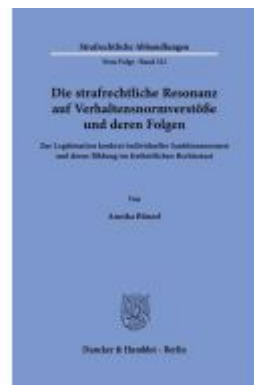
Die strafrechtliche Resonanz auf Verhaltensnormverstöße und deren Folgen Ladenpreis: 82,20EUR