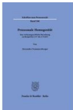
Prozessuale Homogenität Ladenpreis: 92,50EUR