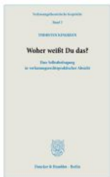
Woher weißt Du das? Ladenpreis: 61,60EUR

Wir haben andere Produkte gefunden, die Ihnen gefallen könnten!