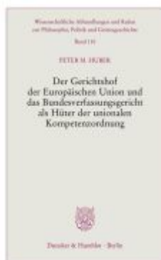
Der Gerichtshof der Europäischen Union und das Bundesverfassungsgericht als Hüter der unionalen Kompetenzordnung. Ladenpreis: 20,50EUR