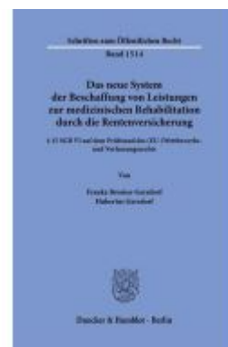
Das neue System der Beschaffung von Leistungen zur medizinischen Rehabilitation durch die Rentenversicherung. Ladenpreis: 51,30EUR