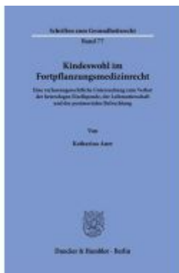
Kindeswohl im Fortpflanzungsmedizinrecht Ladenpreis: 82,20EUR