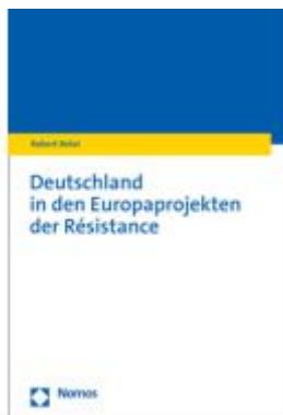
Deutschland in den Europaprojekten der Résistance Ladenpreis: 71,00EUR