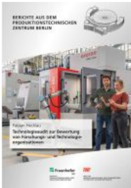
Technologeaudit zur Bewertung von Forschungs- und Technologieorganisationen Ladenpreis: 44,30EUR