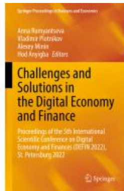
Challenges and Solutions in the Digital Economy and Finance Ladenpreis: 252,99EUR