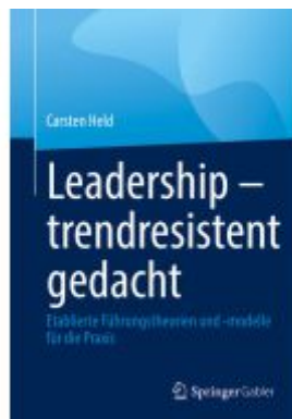
Leadership – trendresistent gedacht Ladenpreis: 41,11EUR