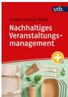
Nachhaltiges Veranstaltungsmanagement Ladenpreis: 28,70EUR