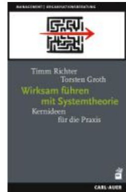
Wirksam führen mit Systemtheorie Ladenpreis: 30,80EUR