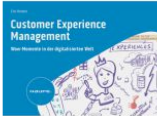
Customer Experience Management Ladenpreis: 30,90EUR

Wir haben andere Produkte gefunden, die Ihnen gefallen könnten!