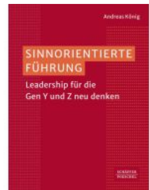
Sinnorientierte Führung Ladenpreis: 51,40EUR