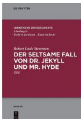
Der seltsame Fall von Dr. Jekyll und Mr. Hyde