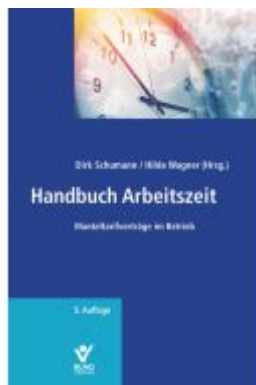
Handbuch Arbeitszeit Ladenpreis: 50,40EUR