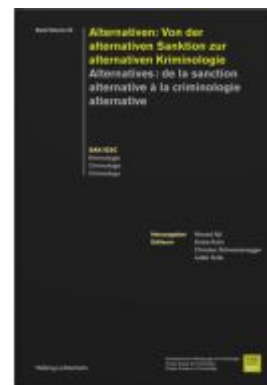
Alternativen: Von der alternativen Sanktion zur alternativen Kriminologie - Alternatives: de la sanction alternative à la criminologie alternative Ladenpreis: 86,00EUR