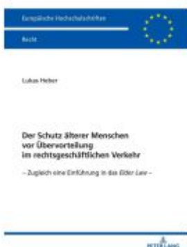
Der Schutz älterer Menschen vor Übervorteilung im rechtsgeschäftlichen Verkehr

Wir haben andere Produkte gefunden, die Ihnen gefallen könnten!