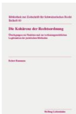
Die Kohärenz der Rechtsordnung Ladenpreis: 42,00EUR