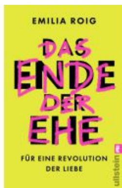
Das Ende der Ehe