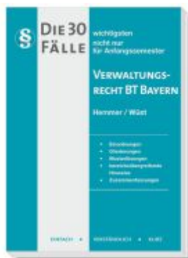
Die 30 wichtigsten Fälle Verwaltungsrecht BT Bayern