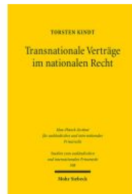
Transnationale Verträge im nationalen Recht