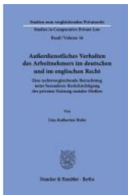
Außerdienstliches Verhalten des Arbeitnehmers im deutschen und im englischen Recht. Ladenpreis: 82,20EUR