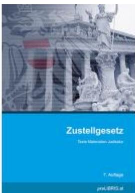
Zustellgesetz Ladenpreis: 26,00EUR