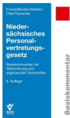
Niedersächsisches Personalvertretungsgesetz Ladenpreis: 60,70EUR