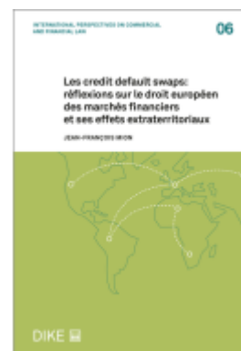
Les credit default swaps: réflexions sur le droit européen des marchés financiers et ses effets extraterritoriaux Ladenpreis: 102,00EUR