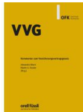
VVG Kommentar Ladenpreis: 183,00EUR