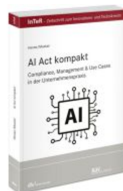
AI Act kompakt Ladenpreis: 91,50EUR