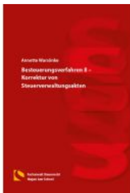
Besteuerungsverfahren II – Korrektur von Steuerverwaltungsakten Ladenpreis: 19,50EUR