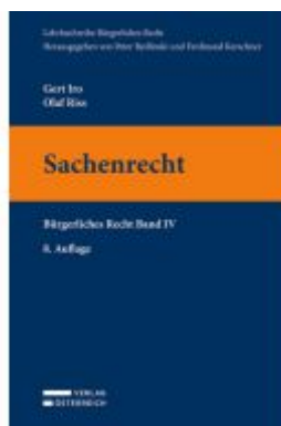
Sachenrecht Ladenpreis: 37,00EUR