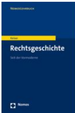
Rechtsgeschichte Ladenpreis: 27,70EUR