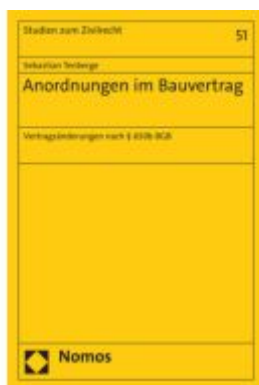
Anordnungen im Bauvertrag Ladenpreis: 86,40EUR