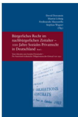
Bürgerliches Recht im nachbürgerlichen Zeitalter - 100 Jahre Soziales Privatrecht in Deutschland, Frankreich und Italien Ladenpreis: 91,50EUR