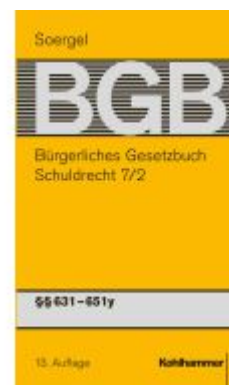
Kommentar zum Bürgerlichen Gesetzbuch mit Einführungsgesetz und Nebengesetzen (BGB) (Soergel) Ladenpreis: 513,00EUR