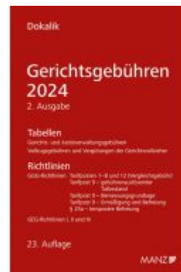
Gerichtsgebühren 2024 Tabellen und Richtlinien Ladenpreis: 46,00EUR