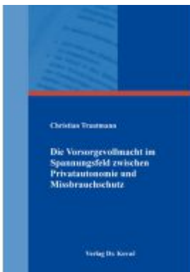
Die Vorsorgevollmacht im Spannungsfeld zwischen Privatautonomie und Missbrauchsschutz Ladenpreis: 102,60EUR