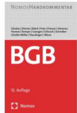
Bürgerliches Gesetzbuch Ladenpreis: 77,10EUR