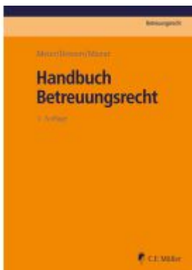
Handbuch Betreuungsrecht Ladenpreis: 87,40EUR

Wir haben andere Produkte gefunden, die Ihnen gefallen könnten!