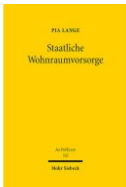
Staatliche Wohnraumvorsorge Ladenpreis: 127,50EUR