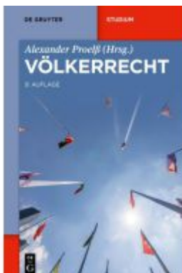
Völkerrecht Ladenpreis: 59,00EUR