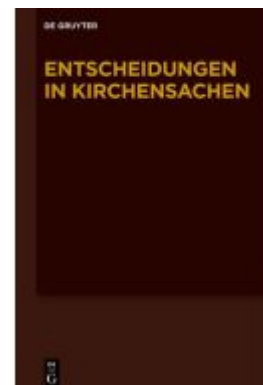
Entscheidungen in Kirchensachen seit 1946 / 1.7.2018-31.12.2018 Ladenpreis: 209,00EUR