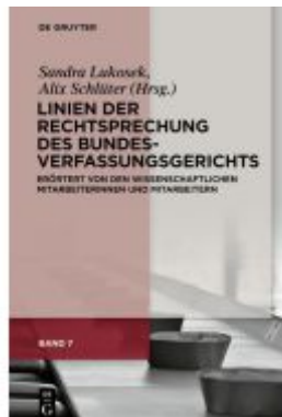
Linien der Rechtsprechung des Bundesverfassungsgerichts Ladenpreis: 159,95EUR