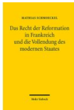
Das Recht der Reformation in Frankreich und die Vollendung des modernen Staates Ladenpreis: 107,00EUR