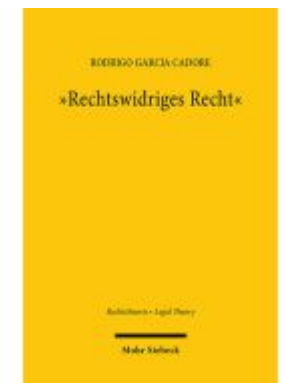
"Rechtswidriges Recht" Ladenpreis: 137,80EUR