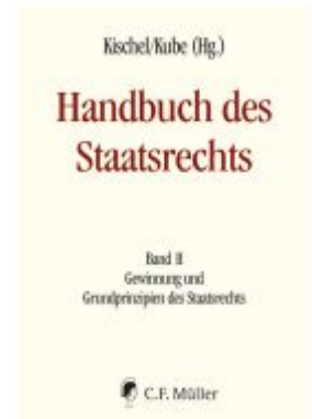
Handbuch des Staatsrechts - Neuauflage Ladenpreis: 257,10EUR