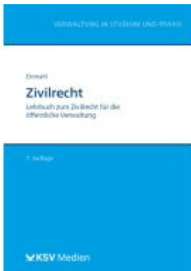
Zivilrecht Ladenpreis: 25,70EUR