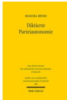
Diktierte Parteiautonomie Ladenpreis: 107,00EUR