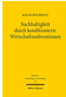
Nachhaltigkeit durch konditionierte Wirtschaftssubventionen Ladenpreis: 86,40EUR