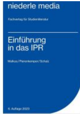
Einführung in das IPR - 2023 Ladenpreis: 15,40EUR