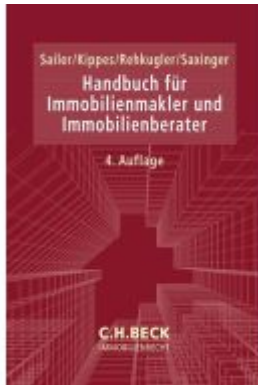
Handbuch für Immobilienmakler und Immobilienberater Ladenpreis: 153,20EUR