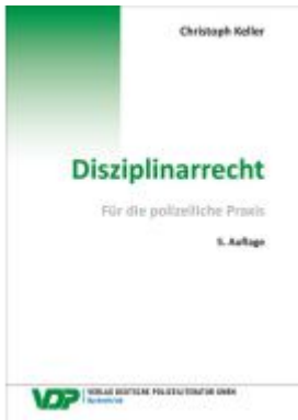
Disziplinarrecht Ladenpreis: 37,10EUR