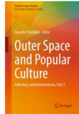
Outer Space and Popular Culture Ladenpreis: 153,99EUR