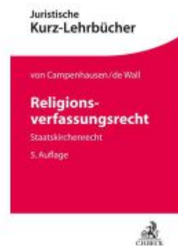
Religionsverfassungsrecht Ladenpreis: 41,00EUR