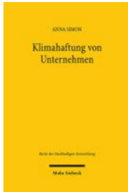
Klimahaftung von Unternehmen Ladenpreis: 71,00EUR