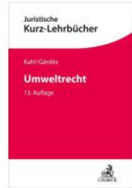
Umweltrecht Ladenpreis: 35,90EUR