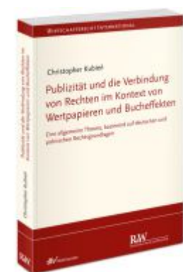
Publizität und die Verbindung von Rechten im Kontext von Wertpapieren und Bucheffekten Ladenpreis: 91,50EUR