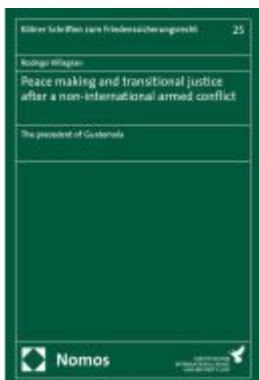
Peace making and transitional justice after a non-international armed conflict Ladenpreis: 173,80EUR

Wir haben andere Produkte gefunden, die Ihnen gefallen könnten!