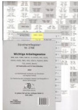
DürckheimRegister® ARBEITSGESETZE MIT STICHWORTEN Ladenpreis: 17,50EUR