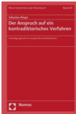
Der Anspruch auf ein kontradiktorisches Verfahren Ladenpreis: 235,50EUR