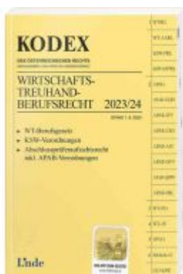
KODEX Wirtschafts-Treuhand-Berufsrecht 2023/24