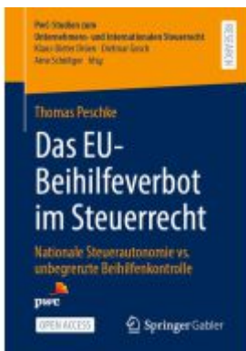
Das EU-Beihilfeverbot im Steuerrecht Ladenpreis: 43,99EUR