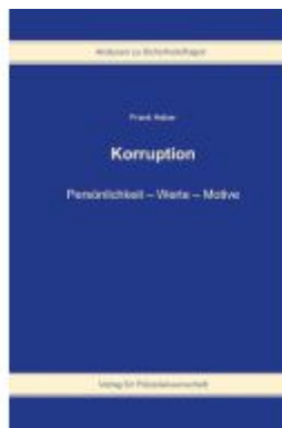
Korruption Ladenpreis: 40,00EUR