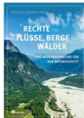
Rechte für Flüsse, Berge und Wälder