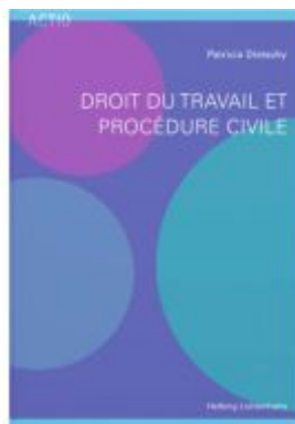
Droit du travail et procédure civile