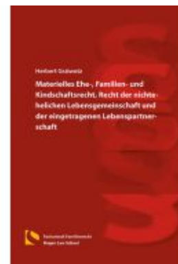
Materielles Ehe-, Familien- und Kindschaftsrecht, Recht der nichtehelichen Lebensgemeinschaft und der eingetragenen Lebenspartnerschaft Ladenpreis: 56,50EUR