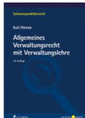
Allgemeines Verwaltungsrecht mit Verwaltungslehre Ladenpreis: 34,00EUR