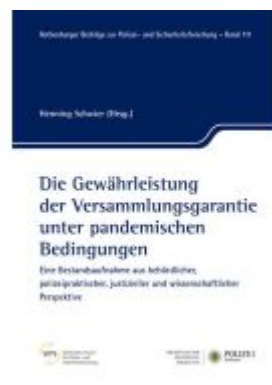
Die Gewährleistung der Versammlungsgarantie unter pandemischen Bedingungen Ladenpreis: 15,50EUR