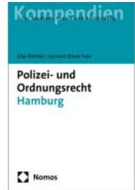
Polizei- und Ordnungsrecht Hamburg Ladenpreis: 29,80EUR