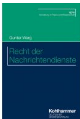
Recht der Nachrichtendienste Ladenpreis: 40,10EUR