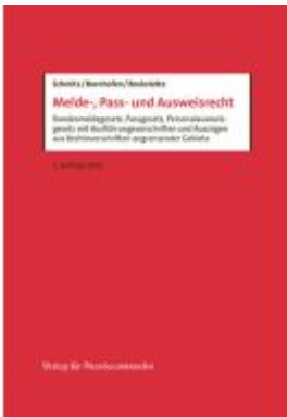
Melde-, Pass- und Ausweisrecht Ladenpreis: 41,00EUR