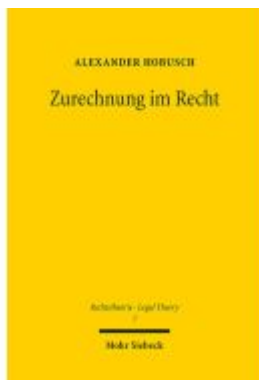
Zurechnung im Recht Ladenpreis: 122,40EUR