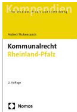
Kommunalrecht Rheinland-Pfalz Ladenpreis: 30,80EUR