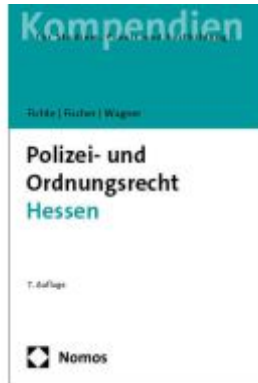
Polizei- und Ordnungsrecht Hessen Ladenpreis: 29,80EUR