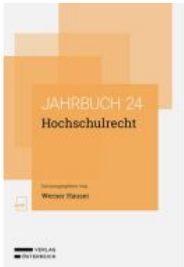
Hochschulrecht Ladenpreis: 86,00EUR