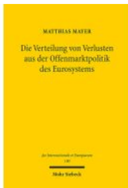
Die Verteilung von Verlusten aus der Offenmarktpolitik des Eurosystems Ladenpreis: 101,80EUR