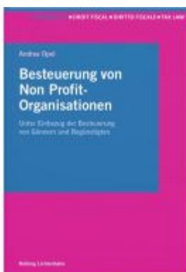
Besteuerung von Non Profit- Organisationen Ladenpreis: 64,00EUR