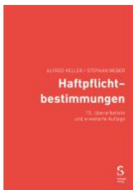
Haftpflichtbestimmungen Ladenpreis: 56,50EUR