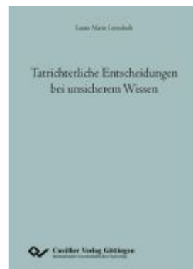
Tatrichterliche Entscheidungen bei unsicherem Wissen Ladenpreis: 86,20EUR