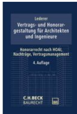
Vertrags- und Honorargestaltung für Architekten und Ingenieure Ladenpreis: 91,50EUR