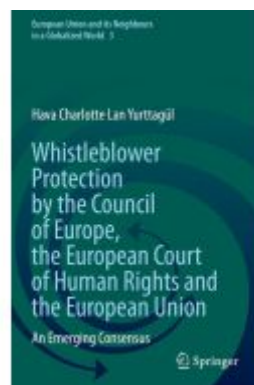
Whistleblower Protection by the Council of Europe, the European Court of Human Rights and the European Union Ladenpreis: 131,99EUR