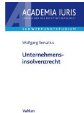
Unternehmensinsolvenzrecht Ladenpreis: 28,80EUR