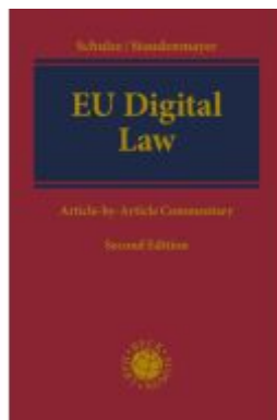
EU Digital Law Ladenpreis: 298,20EUR