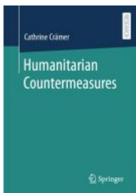
Humanitarian Countermeasures Ladenpreis: 142,99EUR