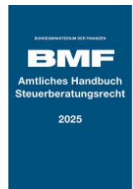
Amtliches Handbuch Steuerberatungsrecht 2025 Ladenpreis: 19,50EUR