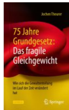
75 Jahre Grundgesetz: Das fragile Gleichgewicht Ladenpreis: 25,69EUR