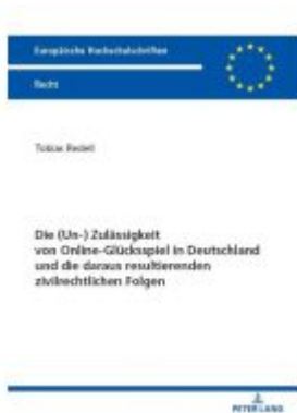
Die (Un-) Zulässigkeit von Online- Glücksspiel in Deutschland und die daraus resultierenden zivilrechtlichen Folgen