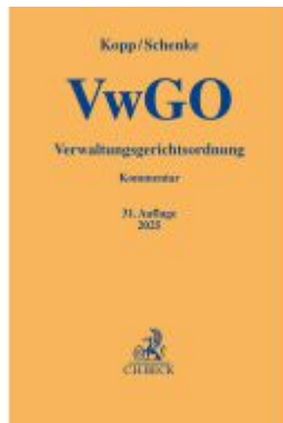
Verwaltungsgerichtsordnung Ladenpreis: 77,10EUR

Wir haben andere Produkte gefunden, die Ihnen gefallen könnten!