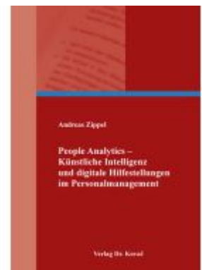
People Analytics - Künstliche Intelligenz und digitale Hilfestellungen im Personalmanagement Ladenpreis: 133,50EUR