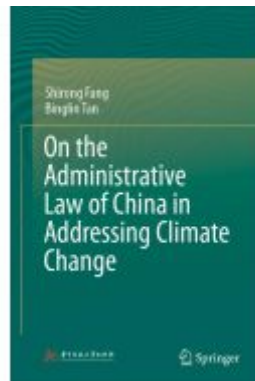
On the Administrative Law of China in Addressing Climate Change Ladenpreis: 175,99EUR