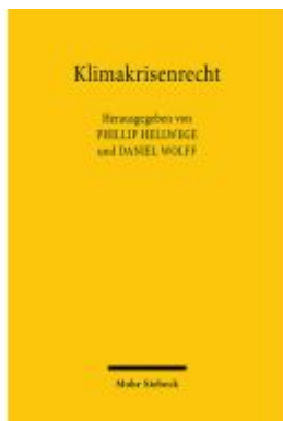
Klimakrisenrecht Ladenpreis: 91,50EUR