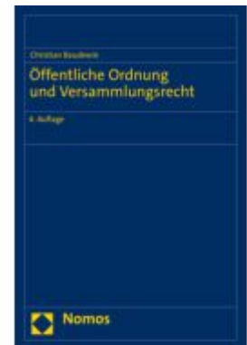
Öffentliche Ordnung und Versammlungsrecht Ladenpreis: 101,80EUR