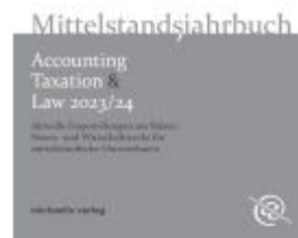
Mittelstandsjahrbuch - Accounting, Taxation & Law 2023/24 Ladenpreis: 30,80EUR