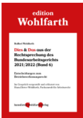
Dies & Das aus der Rechtsprechung des Bundesarbeitsgerichts 2021/2022 Ladenpreis: 30,80EUR