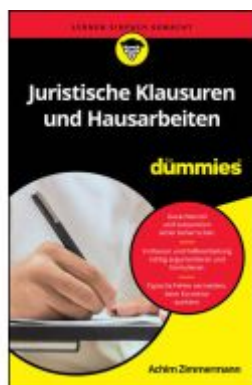
Juristische Klausuren und Hausarbeiten für Dummies