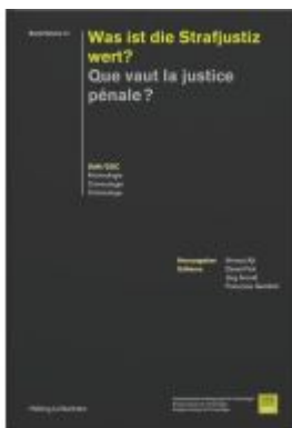
Que vaut la justice pénale? Was ist die Strafjustiz wert? Ladenpreis: 75,00EUR