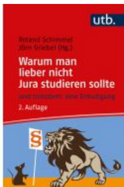
Warum man lieber nicht Jura studieren sollte