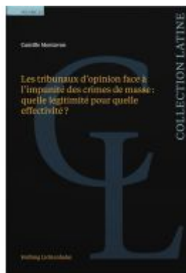
Les tribunaux d'opinion face à l'impunité des crimes de masse: quelle légitimité pour quelle effectivité ? Ladenpreis: 97,00EUR