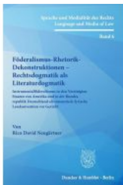
Föderalismus-Rhetorik-Dekonstruktionen – Rechtsdogmatik als Literaturdogmatik.