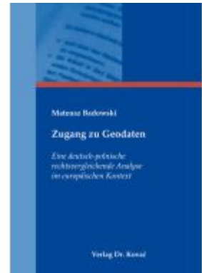
Zugang zu Geodaten Ladenpreis: 101,60EUR