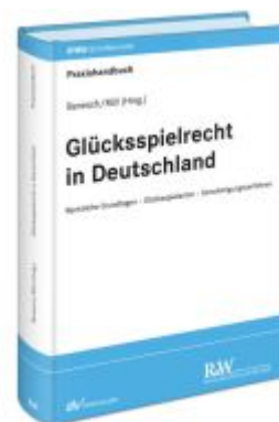
Glücksspielrecht in Deutschland Ladenpreis: 173,80EUR