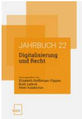
Digitalisierung und Recht Ladenpreis: 84,00EUR