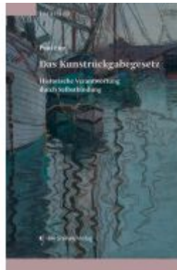
Das Kunstrückgabegesetz Ladenpreis: 78,00EUR