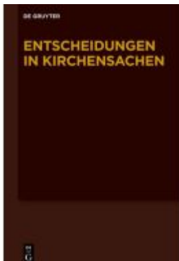
1.7.2018–31.12.2018 Ladenpreis: 209,00EUR

Wir haben andere Produkte gefunden, die Ihnen gefallen könnten!