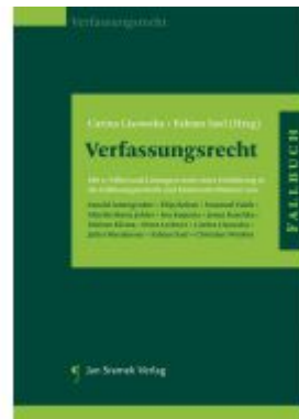
Fallbuch Verfassungsrecht Ladenpreis: 39,90EUR