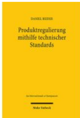
Produktregulierung mithilfe technischer Standards Ladenpreis: 96,70EUR