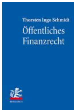
Öffentliches Finanzrecht Ladenpreis: 60,70EUR