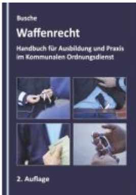
Waffenrecht - Grundlagen im Kommunalen Ordnungsdienst Ladenpreis: 22,70EUR