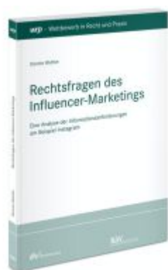
Rechtsfragen des Influencer-Marketings Ladenpreis: 91,50EUR