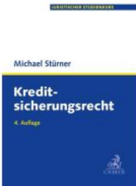
Kreditsicherungsrecht Ladenpreis: 41,00EUR