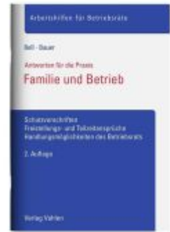
Familie und Betrieb Ladenpreis: 19,50EUR