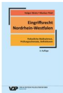
Eingriffsrecht Nordrhein-Westfalen Ladenpreis: 30,80EUR