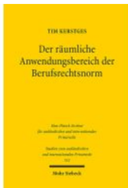
Der räumliche Anwendungsbereich der Berufsrechtsnorm Ladenpreis: 96,70EUR