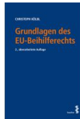
Grundlagen des EU-Beihilferechts Ladenpreis: 66,00EUR