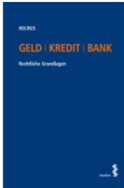
Geld | Kredit | Bank Ladenpreis: 34,00EUR