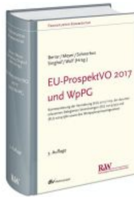
EU-ProspektVO 2017 und WpPG Ladenpreis: 333,10EUR