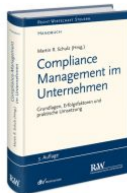
Compliance Management im Unternehmen Ladenpreis: 184,10EUR