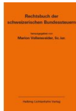
Rechtsbuch der schweizerischen Bundessteuern EL 180 Ladenpreis: 306,00EUR