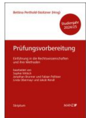
Prüfungsvorbereitung Einführung in die Rechtswissenschaften und ihre Methoden Ladenpreis: 21,40EUR