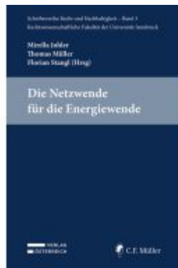
Die Netzwerke für die Energiewende Ladenpreis: 29,00EUR