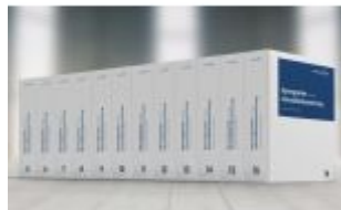
Immobilienbewertung - Lehrbuch und Kommentar Ladenpreis: 319,00EUR