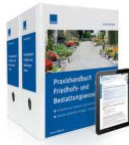
Praxishandbuch Friedhofs- und Bestattungswesen Ladenpreis: 239,80EUR