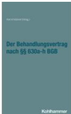
Der Behandlungsvertrag nach §§ 630a-h BGB Ladenpreis: 91,50EUR