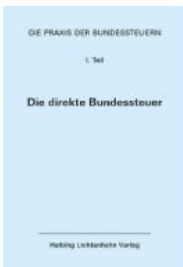
Die Praxis der Bundessteuern: Teil I EL 100 Ladenpreis: 148,00EUR