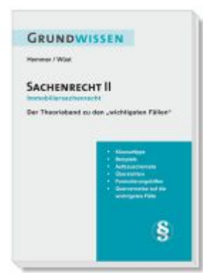
Grundwissen Sachenrecht II - Immobiliarsachenrecht Ladenpreis: 11,10EUR