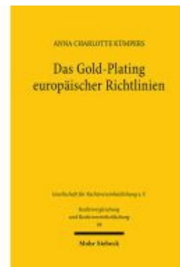
Das Gold-Plating europäischer Richtlinien Ladenpreis: 60,70EUR