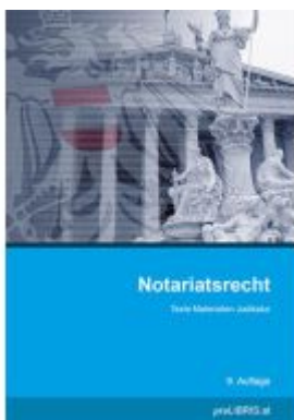
Notariatsrecht Ladenpreis: 43,00EUR