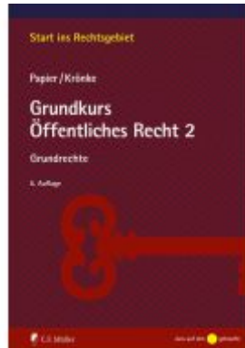
Grundkurs Öffentliches Recht 2 Ladenpreis: 25,70EUR