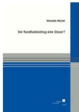
Der Rundfunkbeitrag eine Steuer? Ladenpreis: 35,00EUR