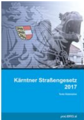
Kärntner Straßengesetz 2017 Ladenpreis: 23,00EUR

Wir haben andere Produkte gefunden, die Ihnen gefallen könnten!