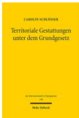
Territoriale Gestaltungen unter dem Grundgesetz Ladenpreis: 81,30EUR