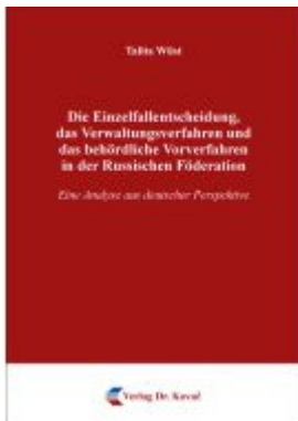
Die Einzelfallentscheidung, das Verwaltungsverfahren und das behördliche Vorverfahren in der Russischen Föderation Ladenpreis: 133,50EUR