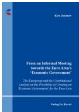
From an Informal Meeting towards the Euro Area's 'Economic Government' Ladenpreis: 91,40EUR