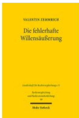
Die fehlerhafte Willensäußerung Ladenpreis: 86,40EUR