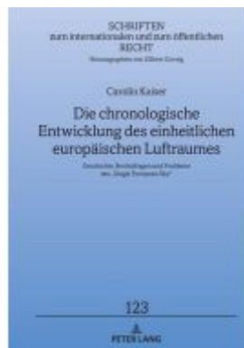
Die chronologische Entwicklung des einheitlichen europäischen Luftraumes Ladenpreis: 97,60EUR