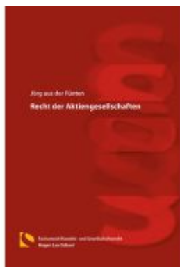
Recht der Aktiengesellschaften Ladenpreis: 46,30EUR