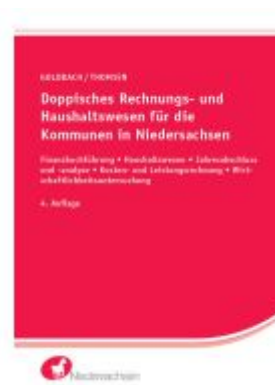
Doppisches Rechnungs- und Haushaltswesen für die Kommunen in Niedersachsen Ladenpreis: 46,30EUR