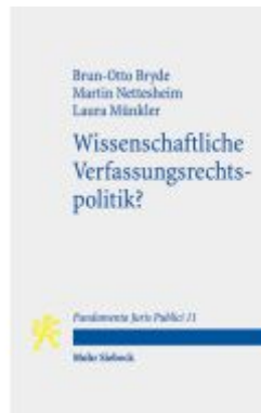
Wissenschaftliche Verfassungsrechtspolitik? Ladenpreis: 18,50EUR