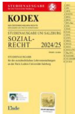
KODEX Studienausgabe Sozialrecht Salzburg 2024/25 Ladenpreis: 12,00EUR