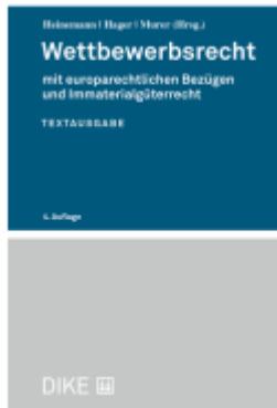
Wettbewerbsrecht Ladenpreis: 64,00EUR