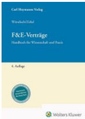
F&E-Verträge Ladenpreis: 214,90EUR