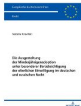
Die Ausgestaltung der Minderjährigenadoption unter besonderer Berücksichtigung der elterlichen Einwilligung im deutschen und russischen Recht Ladenpreis: 56,50EUR