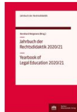
Jahrbuch der Rechtsdidaktik 2020/21 Ladenpreis: 56,60EUR