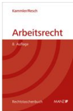
Arbeitsrecht Ladenpreis: 54,30EUR