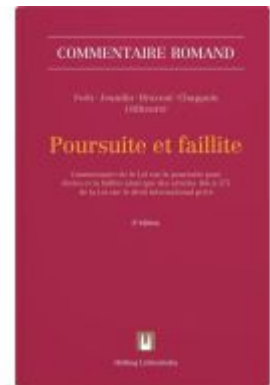
Poursuite et faillite Ladenpreis: 515,00EUR