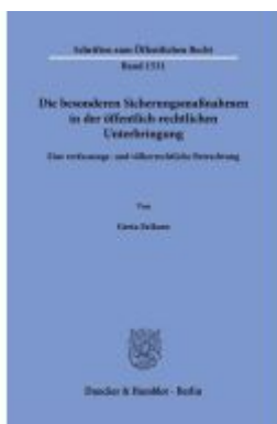
Die besonderen Sicherungsmaßnahmen in der öffentlich-rechtlichen Unterbringung. Ladenpreis: 113,00EUR