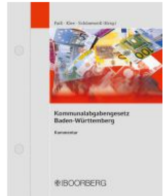
Kommunalabgabengesetz Baden- Württemberg Ladenpreis: 121,40EUR