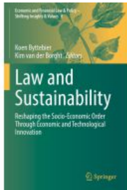
Law and Sustainability Ladenpreis: 175,99EUR