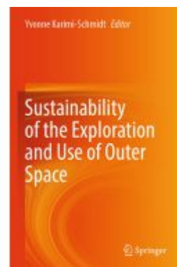
Sustainability of the Exploration and Use of Outer Space Ladenpreis: 164,99EUR