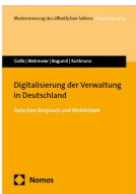
Digitalisierung der Verwaltung in Deutschland Ladenpreis: 50,40EUR