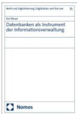
Datenbanken als Instrument der Informationsverwaltung Ladenpreis: 142,90EUR