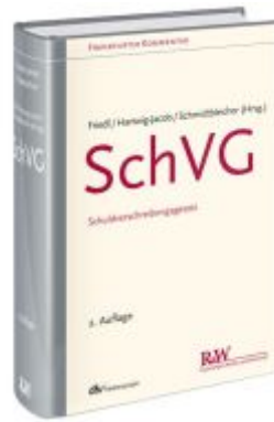
SchVG Ladenpreis: 153,20EUR