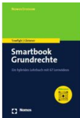
Smartbook Grundrechte Ladenpreis: 27,70EUR