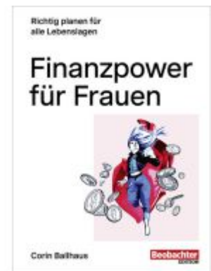
Finanzpower für Frauen Ladenpreis: 39,00EUR