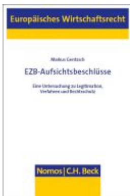
EZB-Aufsichtsbeschlüsse Ladenpreis: 204,60EUR