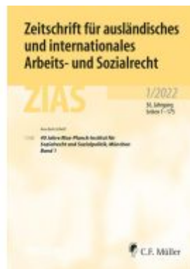
ZIAS 1/2022 Ladenpreis: 97,70EUR