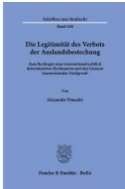
Die Legitimität des Verbots der Auslandsbestechung Ladenpreis: 82,20EUR

Wir haben andere Produkte gefunden, die Ihnen gefallen könnten!