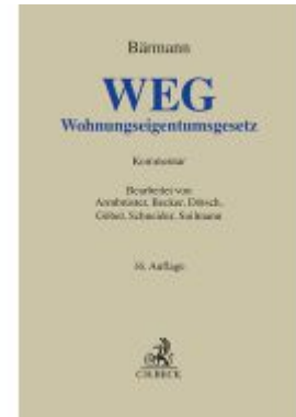
WEG Ladenpreis: 164,50EUR