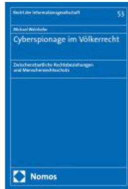
Cyberspionage im Völkerrecht Ladenpreis: 101,80EUR