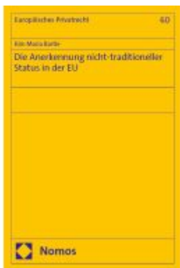
Die Anerkennung nicht-traditioneller Status in der EU Ladenpreis: 163,50EUR