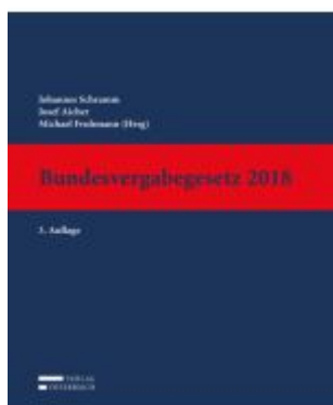
Bundesvergabegesetz 2018 Ladenpreis: 1.299,00EUR