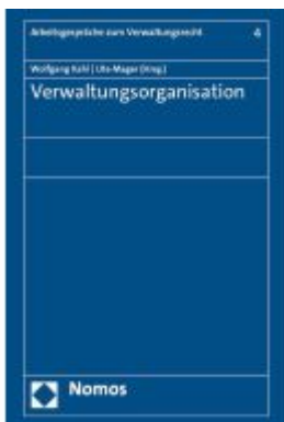
Verwaltungsorganisation Ladenpreis: 127,50EUR