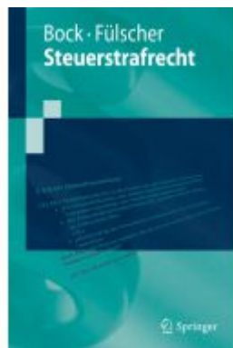
Steuerstrafrecht Ladenpreis: 30,83EUR