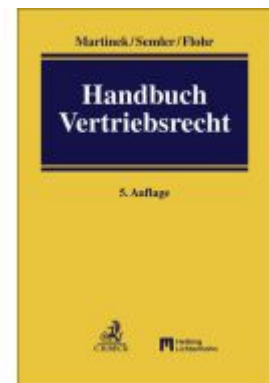
Handbuch Vertriebsrecht Ladenpreis: 307,40EUR