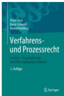
Verfahrens- und Prozessrecht in Amts-, Staatshaftungs- und Entschädigungsverfahren Ladenpreis: 66,81EUR