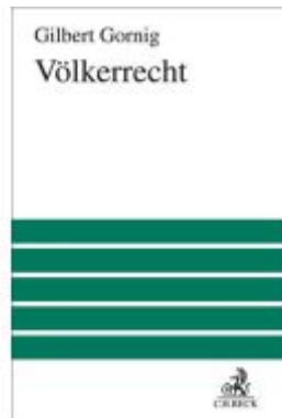
Völkerrecht Ladenpreis: 163,50EUR