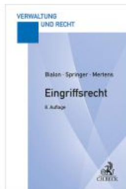
Eingriffsrecht Ladenpreis: 27,70EUR