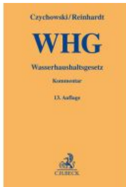
Wasserhaushaltsgesetz Ladenpreis: 194,30EUR

Wir haben andere Produkte gefunden, die Ihnen gefallen könnten!