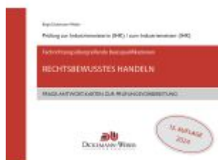
Industriemeister - Frage-Antwort- Lernkarten: Rechtsbewusstes Handeln Ladenpreis: 51,95EUR