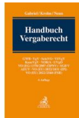
Handbuch Vergaberecht Ladenpreis: 286,90EUR