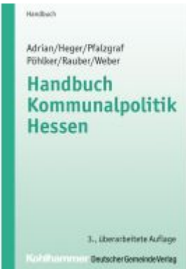
Handbuch Kommunalpolitik Hessen Ladenpreis: 29,90EUR