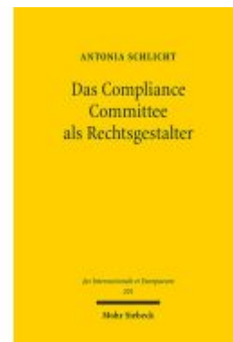
Das Compliance Committee als Rechtsgestalter Ladenpreis: 96,70EUR