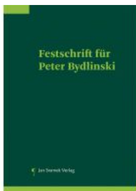
Festschrift für Peter Bydlinski Ladenpreis: 198,00EUR