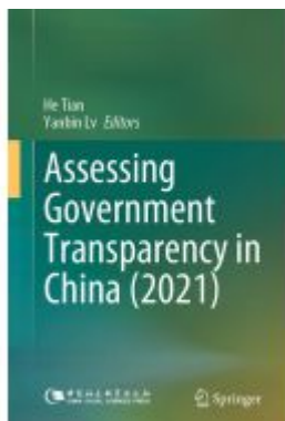
Assessing Government Transparency in China (2021) Ladenpreis: 175,99EUR

Wir haben andere Produkte gefunden, die Ihnen gefallen könnten!