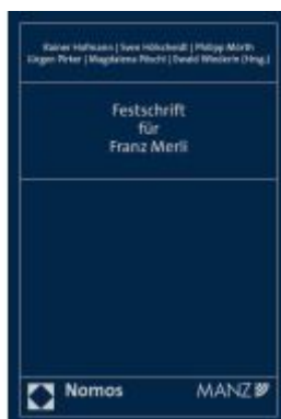
Festschrift für Franz Merli Ladenpreis: 225,20EUR