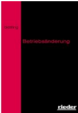
Betriebsänderung Ladenpreis: 25,70EUR