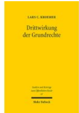
Drittwirkung der Grundrechte Ladenpreis: 76,10EUR