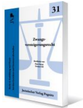
Zwangsversteigerungsrecht Ladenpreis: 27,80EUR