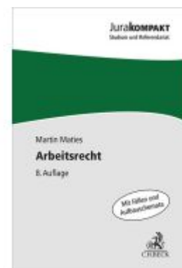
Arbeitsrecht Ladenpreis: 15,40EUR