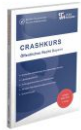
CRASHKURS Öffentliches Recht - Bayern Ladenpreis: 27,70EUR

Wir haben andere Produkte gefunden, die Ihnen gefallen könnten!