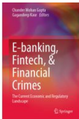
E-banking, Fintech, & Financial Crimes Ladenpreis: 142,99EUR