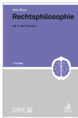
Rechtsphilosophie Ladenpreis: 64,00EUR