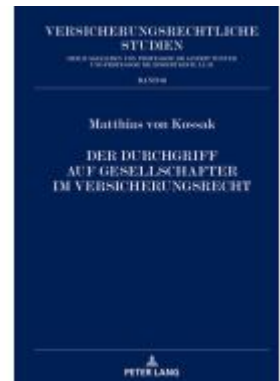
Der Durchgriff auf Gesellschafter im Versicherungsrecht Ladenpreis: 63,70EUR