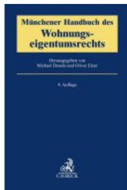
Münchener Handbuch des Wohnungseigentumsrechts Ladenpreis: 214,90EUR