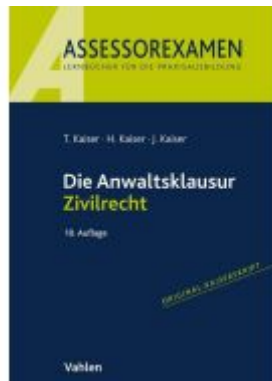
Die Anwaltsklausur Zivilrecht Ladenpreis: 24,60EUR