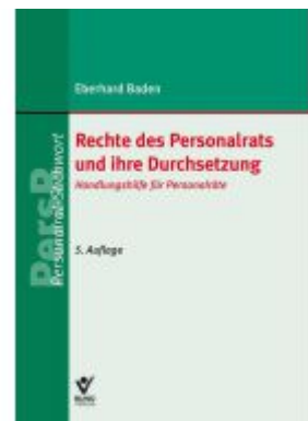
Rechte des Personalrats und ihre Durchsetzung Ladenpreis: 22,70EUR