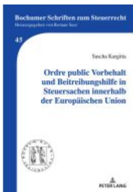
Ordre public Vorbehalt und Beitreibungshilfe in Steuersachen innerhalb der Europäischen Union Ladenpreis: 56,50EUR