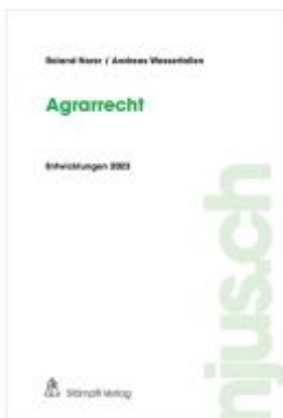
Agrarrecht Ladenpreis: 81,20EUR