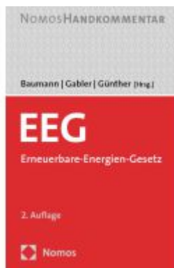
EEG Ladenpreis: 183,00EUR