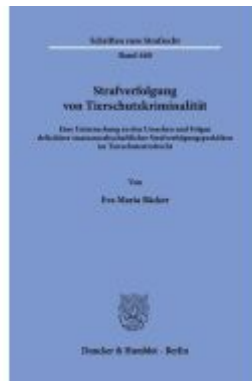
Strafverfolgung von Tierschutzkriminalität Ladenpreis: 92,50EUR