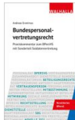
Bundespersonalvertretungsrecht Ladenpreis: 99,95EUR