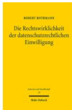
Die Rechtswirklichkeit der datenschutzrechtlichen Einwilligung Ladenpreis: 86,40EUR