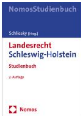
Landesrecht Schleswig-Holstein Ladenpreis: 35,90EUR

Wir haben andere Produkte gefunden, die Ihnen gefallen könnten!