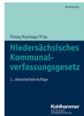
Niedersächsisches Kommunalverfassungsgesetz Ladenpreis: 50,40EUR