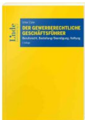
Der gewerberechtliche Geschäftsführer Ladenpreis: 49,00EUR