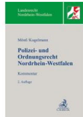
Polizei- und Ordnungsrecht Nordrhein- Westfalen Ladenpreis: 132,70EUR